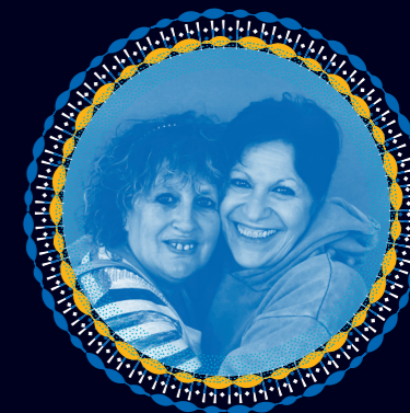
Joe Beltran Babé Gonzalez CALMARS FARCIS AU PESCAÛ GRAULEN

Un soupçon de ras-el-hanout, deux pistils de safran et pas d'os à rouziguer.