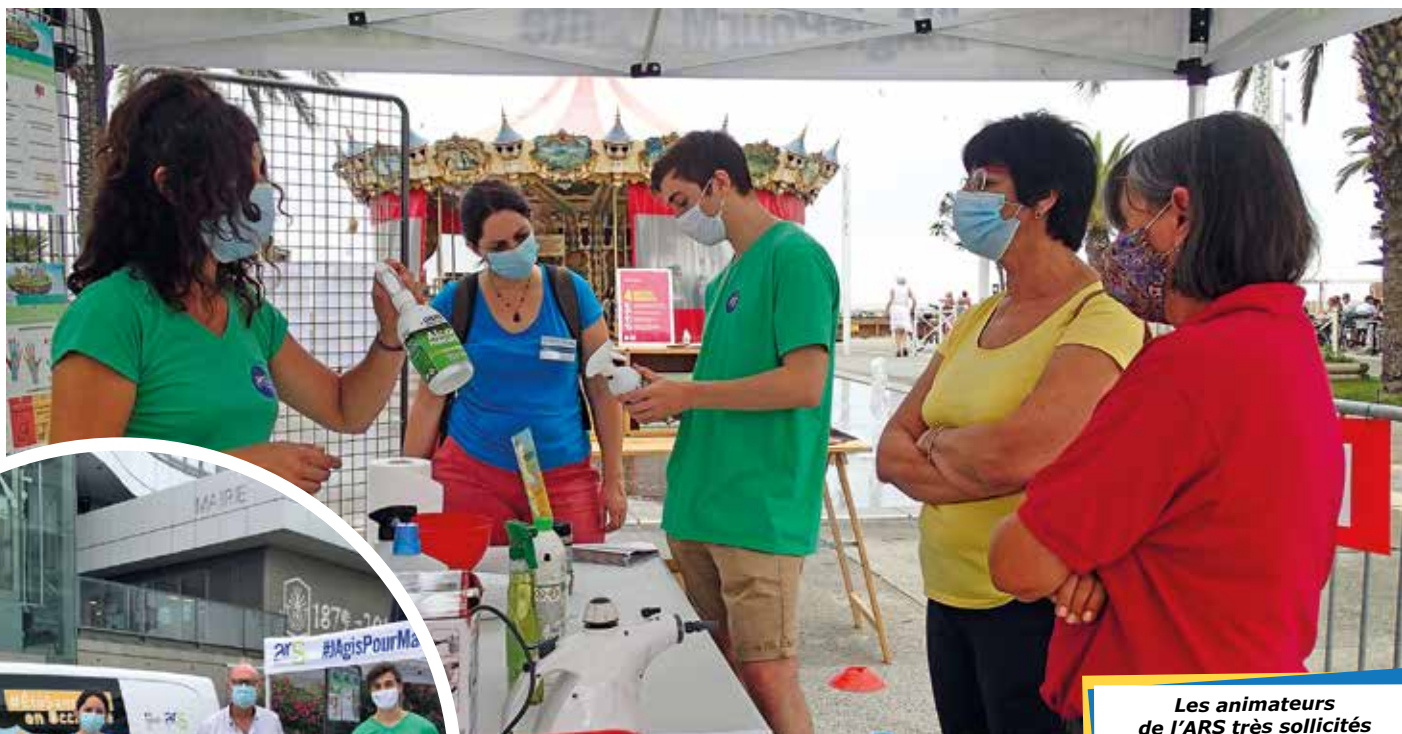
Les animateurs de l'ARS très sollicités