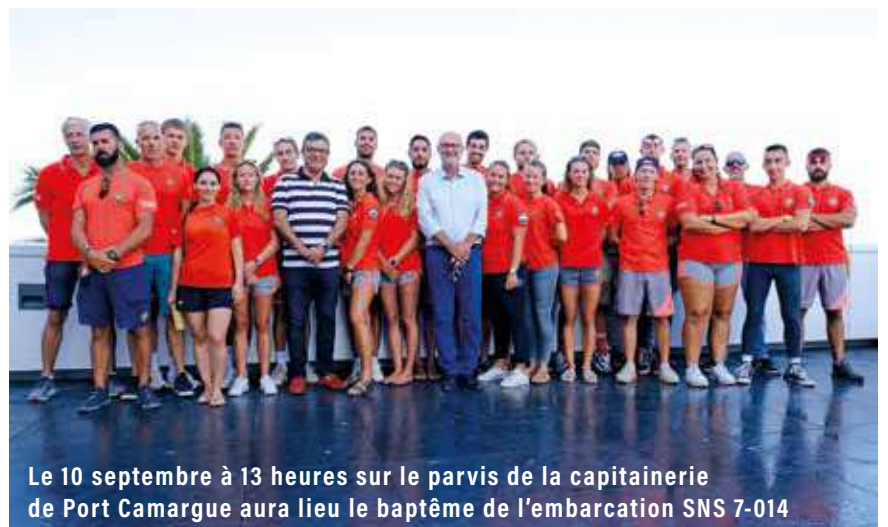
Le 10 septembre à 13 heures sur le parvis de la capitainerie de Port Camargue aura lieu le baptême de l'embarcation SNS 7-014

bien et cela crée une plus-value au niveau des résultats », s'est réjoui Philippe Grau, président de la station SNSM du Grau du Roi. Après avoir laissé la parole aux jeunes maîtres-nageurs sauveteurs venus de Bordeaux, Lyon, Montpellier, Lorient, La Rochelle ou Amiens, le maire a conclu en mettant l'accent sur l'accompagnement des personnes à mobilité réduite à l'Handiplage sur lequel veille la SNSM. « Nous consacrons 1 500 000 € de budget pour les plages de la commune qui sont un pilier de l'économie locale. »